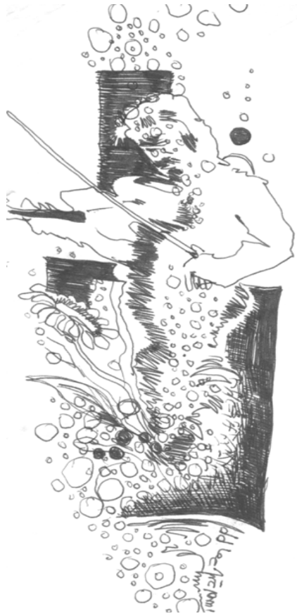
(بچوكترين زيندووى من)

بۇ ئەللىزا دووھەمىن بچوكترين زيندووى من بەر لە من ئۇرئانا قاللاچى لەكتىبى پەيامىك بۇ ئەو كۆرپەيەي كە ھەر لەدايك نەبوو دا نووسى شتىك نىيە لە نەبوون خراپتر، منىش لەدوا دىپرى كىتیبەكەى خۇمدا نووسىم شتىك نىيە لەبوون خراپتر، تۆ ئەى ئەوہى ئەم دەقە ئەخوینىتەوہ پىت وا نەبىت ئەتوانى رەھايى كۆتا لە ھىچ يەك لەم دوو رستەيەدا ھەلبىگرىتەوہ، ئەكرىت ئەمە دوو نەفەسى جىباى نىو دوو دىپرى تارىك بىت لەبەردەم دوو سەفەرى تارىكدا، قسەيەكى ترە لەبوون كە رەنگە ھەردووكيان بىت و ھىچىشيان نا؟! نازانم لەتارىكىم گرتوہيان لەنوور، شەيتان ئەخەمەوہ يان فرىشتە مەسىح پىيە يان دەجال تۆ ئەى بچوكترين زيندووى من ئەى ئەوہى بەم ھەمووہ نازيندوويىوہ لەم منە تارىكەيا زيندووى، تۆ زيندوويى و ھەزەكەم زيندوويى تۆ نازيندوويى من مەحكوم كات!! ژيان خەرىكە جارىكى ترەك بى ئابروويىم بەم شىعەرەوہ كە ھەمىشە لەنووسىنى ئەترسام لەرەحمى منەوہ رىدەكات!! ئۇرئانا ئەلى: