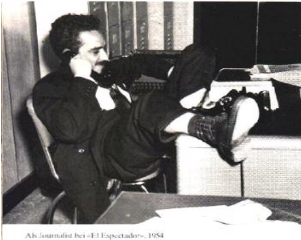
As Journalist bei «El Espectador», 1954

ماركيز وهك رۆژنامه‌نوس له رۆژنامه‌ى ئىل ئىسپكتادۆر 1954