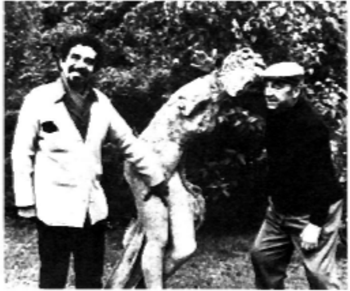
12. Mir Pablo Neruda in der Normandie.