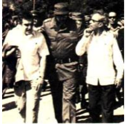
ماركيز و كاسترو