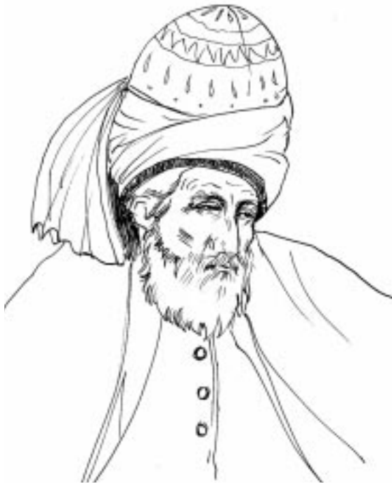
مهولانا جه لاله ددینی رومی

له بهر ئه وهی لای شه مس خواوند زور نریکه، چونکه خوئی ده فهرموت: (نحن أقرب الیه من جبل الورد)، خواوند لیتمان دوور نیبه و له ئاسمانه بهرزه کان نیبه، به لکو له ناوه وهی هه موو ئیمه دایه، وازمان لی ناهینیت. که خاوهن میوانخانه که گوئی له م قسانه ی شه مس ده بیت، لئی ده پرسیت: ئه گهر خواوند لیره یه و وه ستاوه و ناجوولیت، ئیمه ش له خراپترین بارداین، ئه مه چی ده گه به نیت؟ له م کاته دا شه مس به کم رتسا له چل رتسا که ی ده خاته روو: (۱) ئه و رتگایه ی خواوندی پی ده بینین، رهنگدانه وهی ئه و رتگایه یه که به هویه وه سه بری خوومان ده که یین و خوومانی پی ده بینین، ئه گهر خواوند جگه له ترس و سه رزه نشتی هیچ شتییکی دیکه بو عه قلمان نه هینیت، ئه مه ئه وه ده گه به نیت، که برتکی زوری ترس له نه فسی خوومان هه لده قولیت، به لام ئه گهر خواوند نمان بینی پریته ی له خووشه ویستی و به زه یی، ئیمه ئه و کاته وای ده بینین). لاپه ره ۴۸. خاوهن مه یخانه که له شه مس ده پرسیت: ئه و قسه یه ی تو جیاوازی چییه له گه ل ئه و قسه یه ی که ده لیتن خواوند هه لبه سترای خه یالمانه؟ له و کاته دا دوو کهس له مه یخانه که دا به شهر دین و