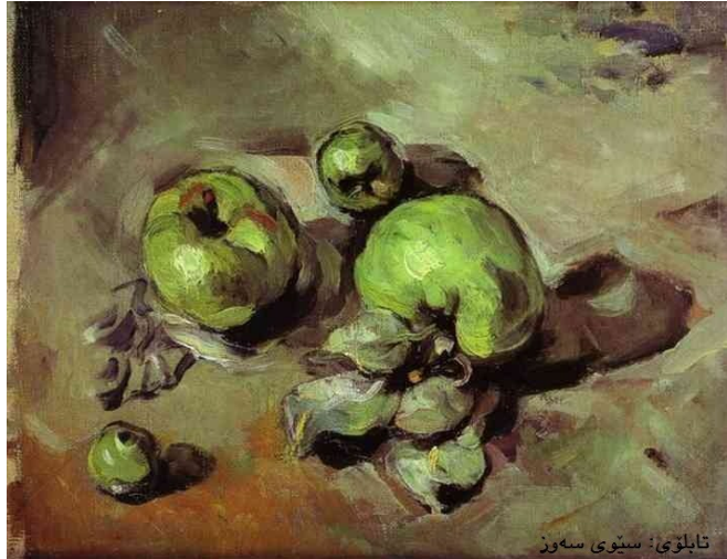
تابلۆى: سىوى سەوز

خەسلەتى ھزرىيە و مامەلەى بوون دەكات لە پنتىكدا قول دەبىتەو، بىنەر لە بەردەم ئەم تابلۆيەدا زياتر لە ھەرشىكى تر ھەست بە بوون بكات، ئەمەش لەرىگەى بەكارھىنانى رەنگ و سىبەر و پوناكىەوہ تا دەكات بە فۆرمە جياوازەكان دروست بووہ و، تەكنىكى ھونەرى ئەم تابلۆيە جەخت لەوہ دەكاتەوہ كە سىوى سەوز دەپەويت شتىك لە بوون پيشانبدات.